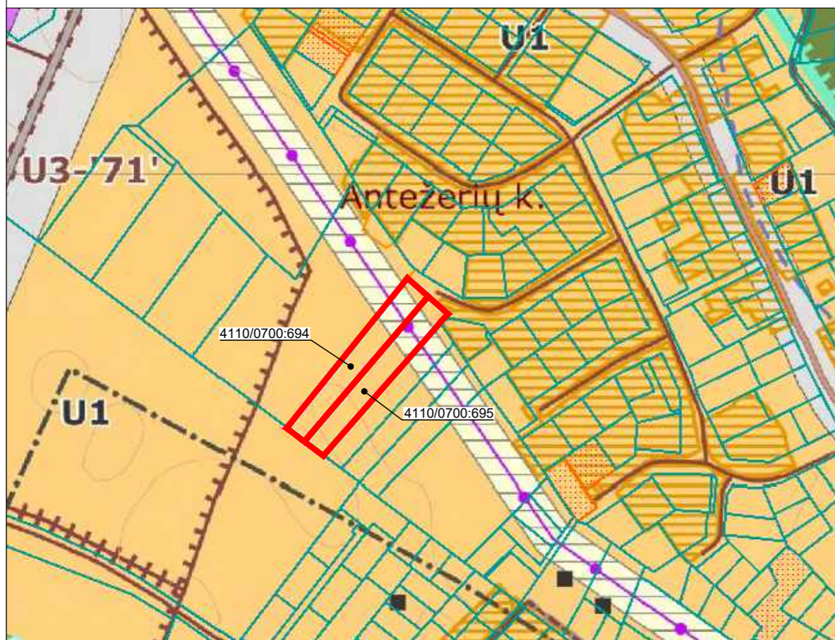
I Straukė Vilniaus rajono savivaldybės teritorijos dalies („U“ žemės naudojimo funkcinės zonos Avizių, Juodšilių, Nemėžio, Pagirių, Riešės, Rudaminos ir Žužūnų seniūnijose) bendrojo plano (TPD reg. Nr. T00084195)