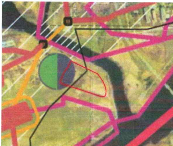
Jurbarko miesto ir rajono vandens tiekimo ir nuotekų tvarkymo infrastruktūros plėtros specialiojo plano ištrauka

Pagal Jurbarko miesto ir rajono vandens tiekimo ir nuotekų tvarkymo infrastruktūros plėtros specialiojo plano sprendinius šalia planuojamos teritorijos yra numatomi rekonstruoti nuotekų valymo įrenginiai. Pagal specialiojo plano sprendinius vakarinėje pusėje yra savitakiniai nuotekų tinklai.