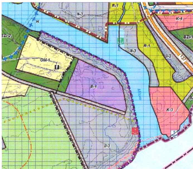
Jurbarko miesto savivaldybės teritorijos bendrojo plano pakeitimo ištrauka

Detalusis planas rengiamas vadovaujantis Jurbarko miesto savivaldybės teritorijos Bendrojo plano pakeitimu, patvirtintu Jurbarko rajono savivaldybės tarybos 2023-06-29 sprendimu Nr. T2-191.